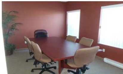
Salle de conférence